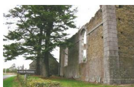
Temples - vue de la route

Le consistoire de l'Eglise réformée du Chefresne, et son pasteur résidant, entreprendront la construction d'un temple au lieu-dit le Neufbourg entre 1817 et 1824. Ce petit temple sera restauré en 1857, 1878 et 1883 année où le lambris portait la signature de « Thoury » le